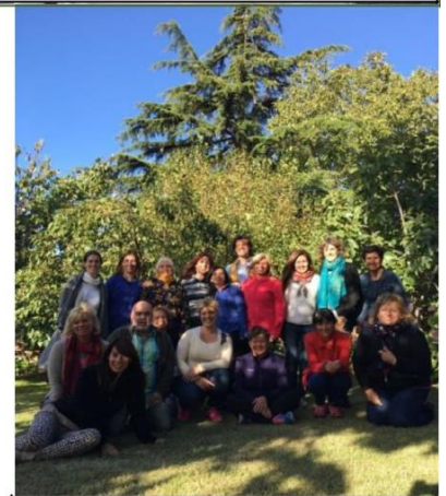
Curso Básico Tandil

Su propósito personal y humano es dar a conocer esta simple y profunda técnica de sanación, nutriéndose continuamente para poder llevar clara y fielmente estas enseñanzas a los participantes.